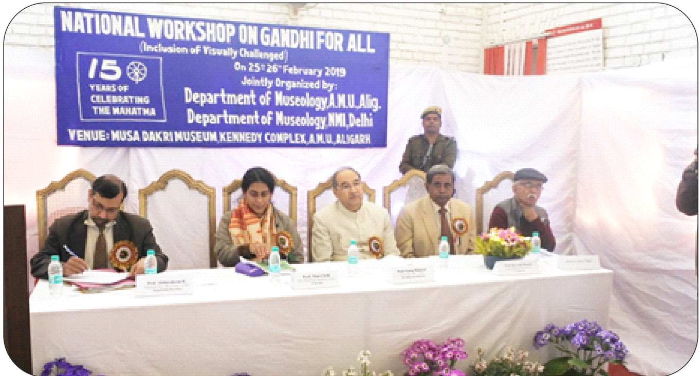
RAs of the department of Museology with the school students who participated in the workshop