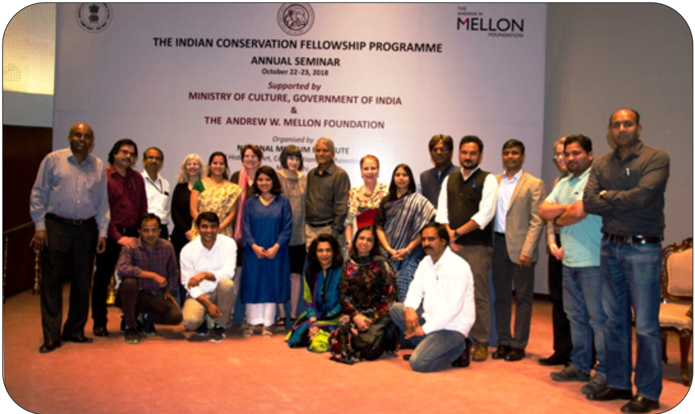
Alumni and Organizers of The Indian Conservation Fellowship Programme's Annual seminar on 22-23 October, 2018