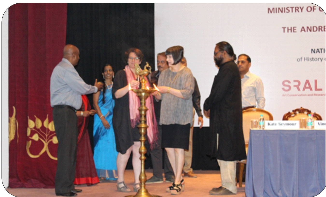
Inaugural Session of The Indian Conservation Fellowship Programme's Annual Seminar on 22- 23 October, 2018