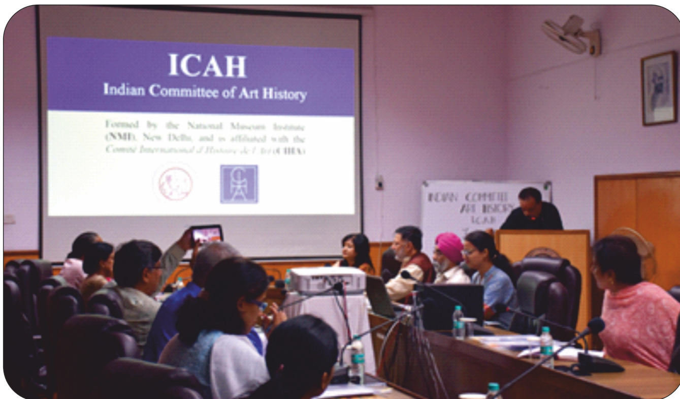
First formal meeting of the honorary members of the newly formed committee, Indian Committee of Art History (ICAH) held on May 1st, 2018.