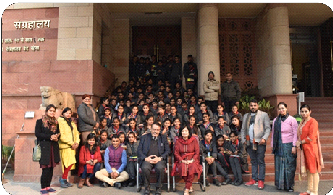
A one day workshop on 'Different Forms of Indian Art' as part of Village Outreach program was organised by Department of History Art for the students and Teachers of Kendriya Vidyalaya, NTPC Dadri, Uttar Pradesh on 1st February, 2019.