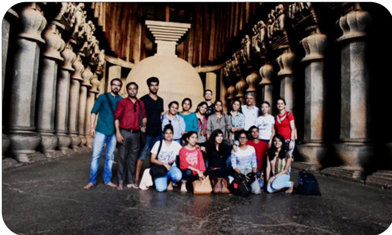
Educational tour : Pune and Aurangabad (Ajanta Ellora etc.) 13–23 September 2018.