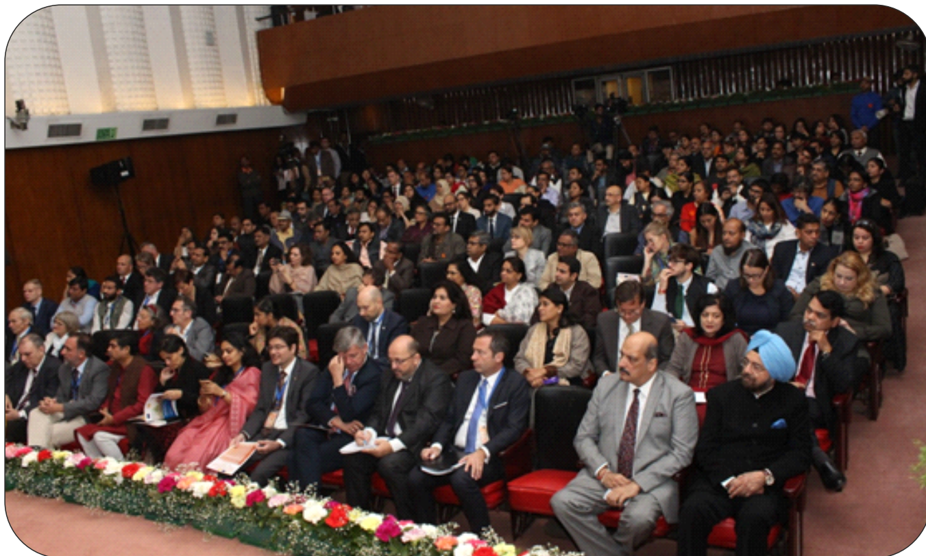
Two Day International Conference EU-India Partnership on Cultural Heritage 4-5 December 2018.