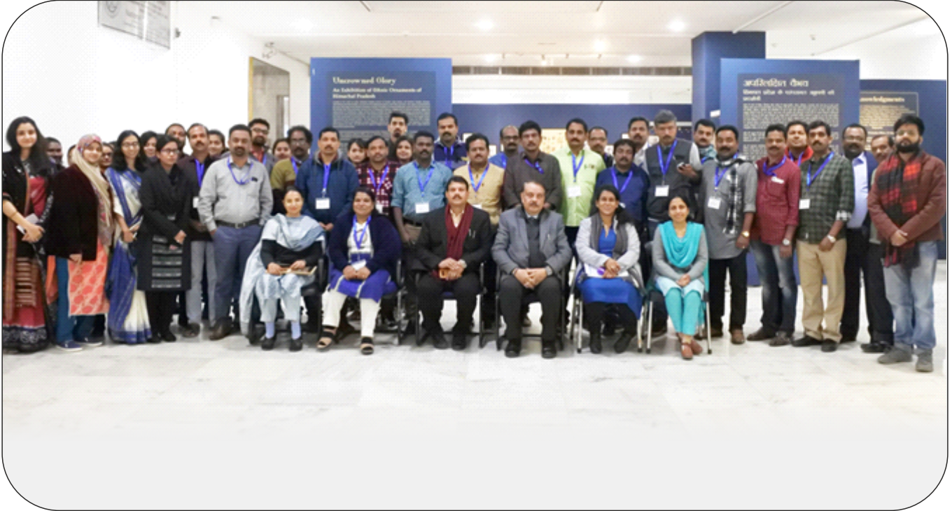
Participants of the Training course with Hon'ble VC , Dean, NMI and Director Institute of Archaeology, ASI