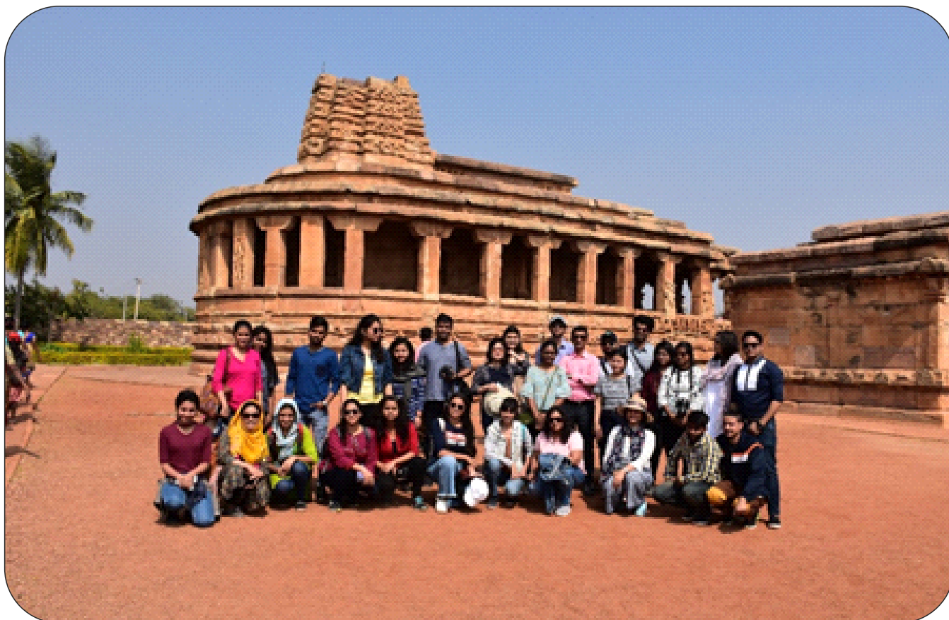
A study tour for M.A 4th Semester students was organised to the world Heritage sites of Karnataka from 11th to 21st January, 2019 January 2019.