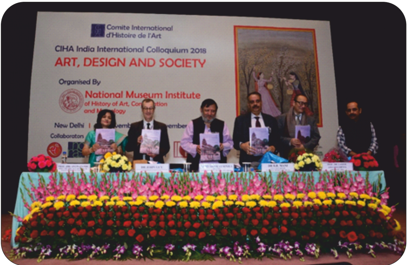
National Museum Institute in collaboration with the Comité International d'Histoire de l'Art (CIHA), National Museum, National Gallery of Modern Art (NGMA), and Indira Gandhi National Centre for the Arts (IGNCA) organized a three-day International Colloquium from November 28th, 2018 to November 30th, 2018 in New Delhi.