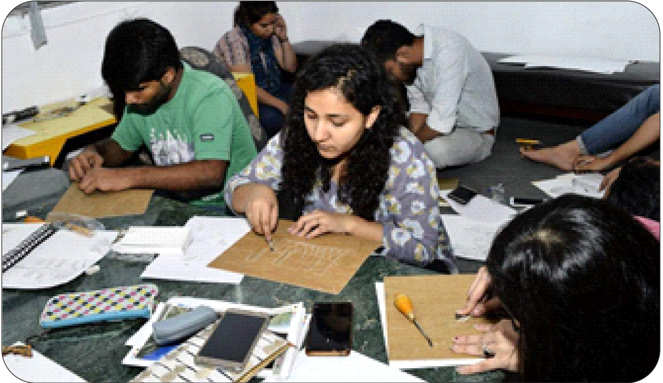
Three day Linocut Printmaking Workshop from 10th to 13th October, 2018 for 3rd Semester Students organised at National Gallery of Modern Art, New Delhi