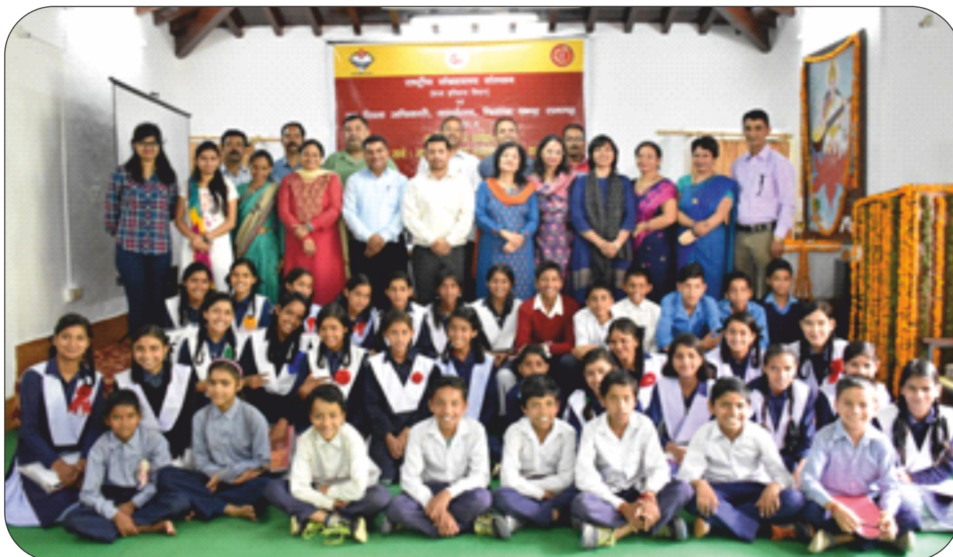
As a part of Village Outreach program, a three-day workshop was organised in Ramgarh, Uttarakhand from 11th to 13th September, 2018.