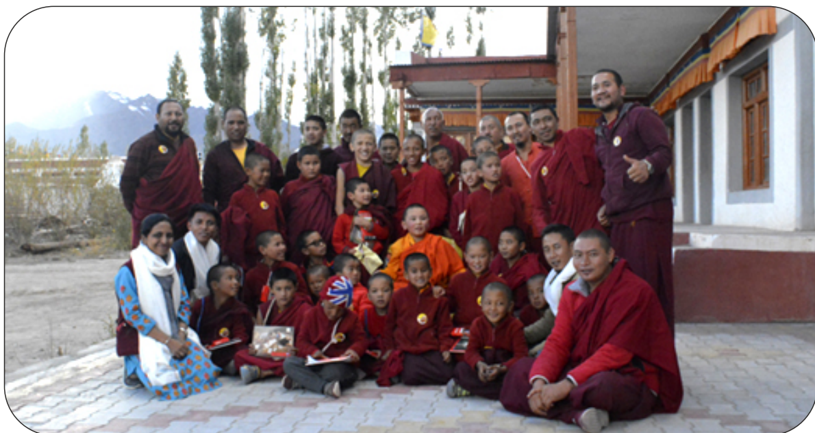
Activity session during the workshop